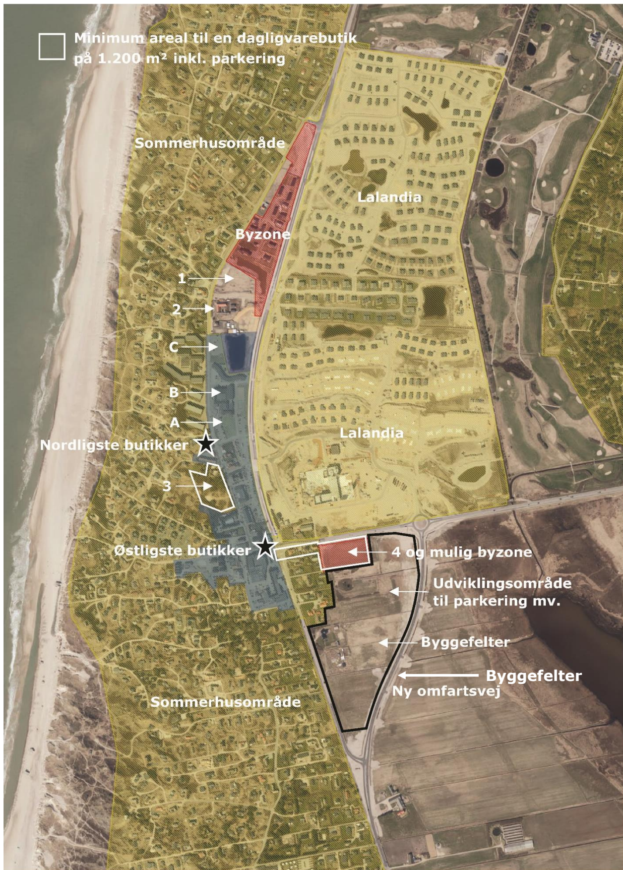
Figur 5-1 Kortet viser nuværende byzone (rød) og sommerhusområde (gul) samt mulige områder til udvikling af handelslivet inden for bymidteafgrænsningen (A, B og C) og muligheder for udvidelse af bymidten (1, 2, 3 og 4). Endelig viser kortet, hvordan området mellem den nye omfartsvej og den eksisterende by planlægges udnyttet.