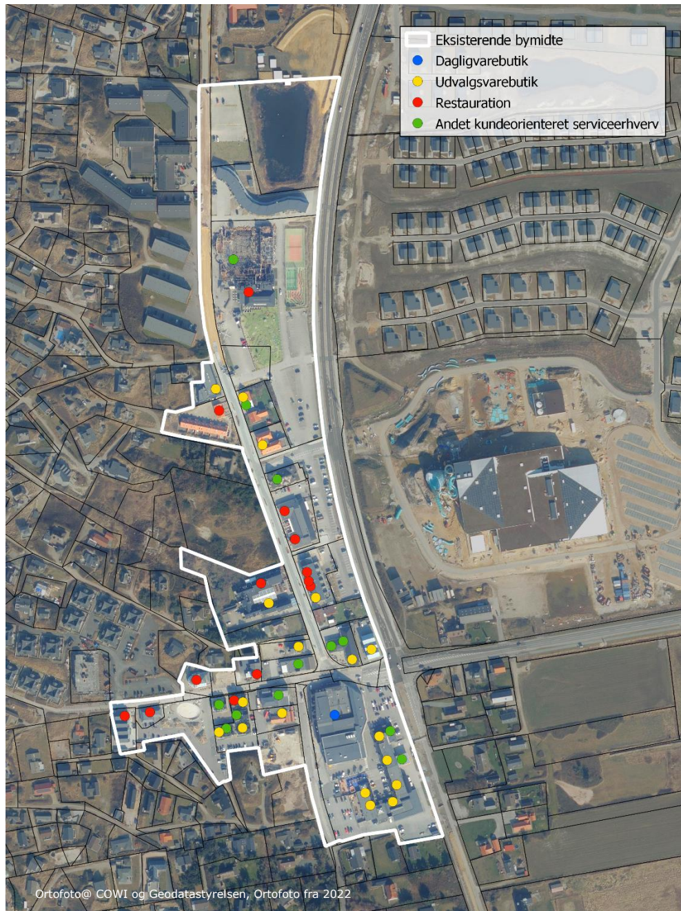
Figur 4-1 Eksisterende detailhandel og kundeorienterede serviceerhverv indenfor Søndervig bymidtes nuværende afgrænsning. Butikker og service ligger hovedsageligt i den sydlige og centrale del af bymidten.

Som det fremgår af figur 4-1, ligger tyngdepunktet i bymidten omkring krydset mellem Badevej og Lodbergsvej. Bymidstens funktioner tynder ud mod nord, hvor det brændte bowlingcenter ligger sammen med en restaurant samt legeplads, minigolfbane, tennisbaner, parkering og et større regnvandsbassin.