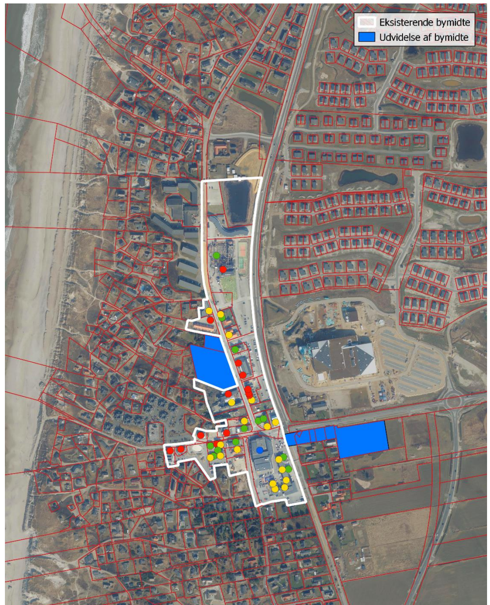
Figur 1-1 Nuværende bymidte i Søndervig og de ønskede udvidelser af bymidten (blåt areal).