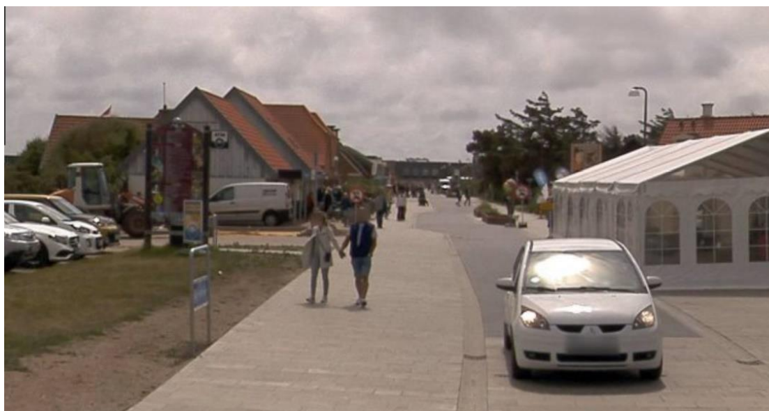
Figur 5-2 Lodbergsvej er blevet indrettet på fodgængernes præmisser med en smal og ensrettet kørebane og opholdsarealer med brede fortove, grønne bede, bænke mv. Trafikken er ensrettet fra centrum mod nord. Vejen egner sig ikke til at betjene en dagligvarebutik, som sammenlignet med andre bymidtefunktioner skaber en større mængde kundetrafik og har større behov for varetilkørsel med lastbiler og sættevogne.

Det vurderes endvidere, at den smalle og ensrettede kørebane ikke opfylder krav til tilgængelighed for kunder til en ny dagligvarebutik, ligesom det kan blive problematisk at afvikle varetilkørslen på den smalle og ensrettede kørebane. Trafikalt egner Lodbergsvej sig bedre til udvalgs varebutikker, spisesteder, kundeorienteret service og kultur- og fritidstilbud, som skaber mindre biltrafik og mindre varetilkørsel.