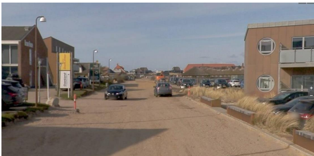
Figur 5-3 Den nordlige del af bymidten, hvor bymidten er begrænset til østsiden af Lodbergsvej (til venstre i billedet) og udnyttet til fritidsaktiviteter. Lodbergsvej er på billedet under ombygning og vil blive indrettet med en smal og ensrettet kørebane ligesom resten af vejen.

Endelig vurderes det, at en placering af en dagligvarebutik på 1.200 m 2 med biladgang fra Lodbergsvej ikke vil være kommercielt interessant for en dagligvarebutik på grund af den begrænsede tilgængelighed. Det vurderes derfor, at der ved planlægning for en dagligvarebutik ved Lodbergsvej vil være betydelig risiko for, at planerne ikke kan realiseres.