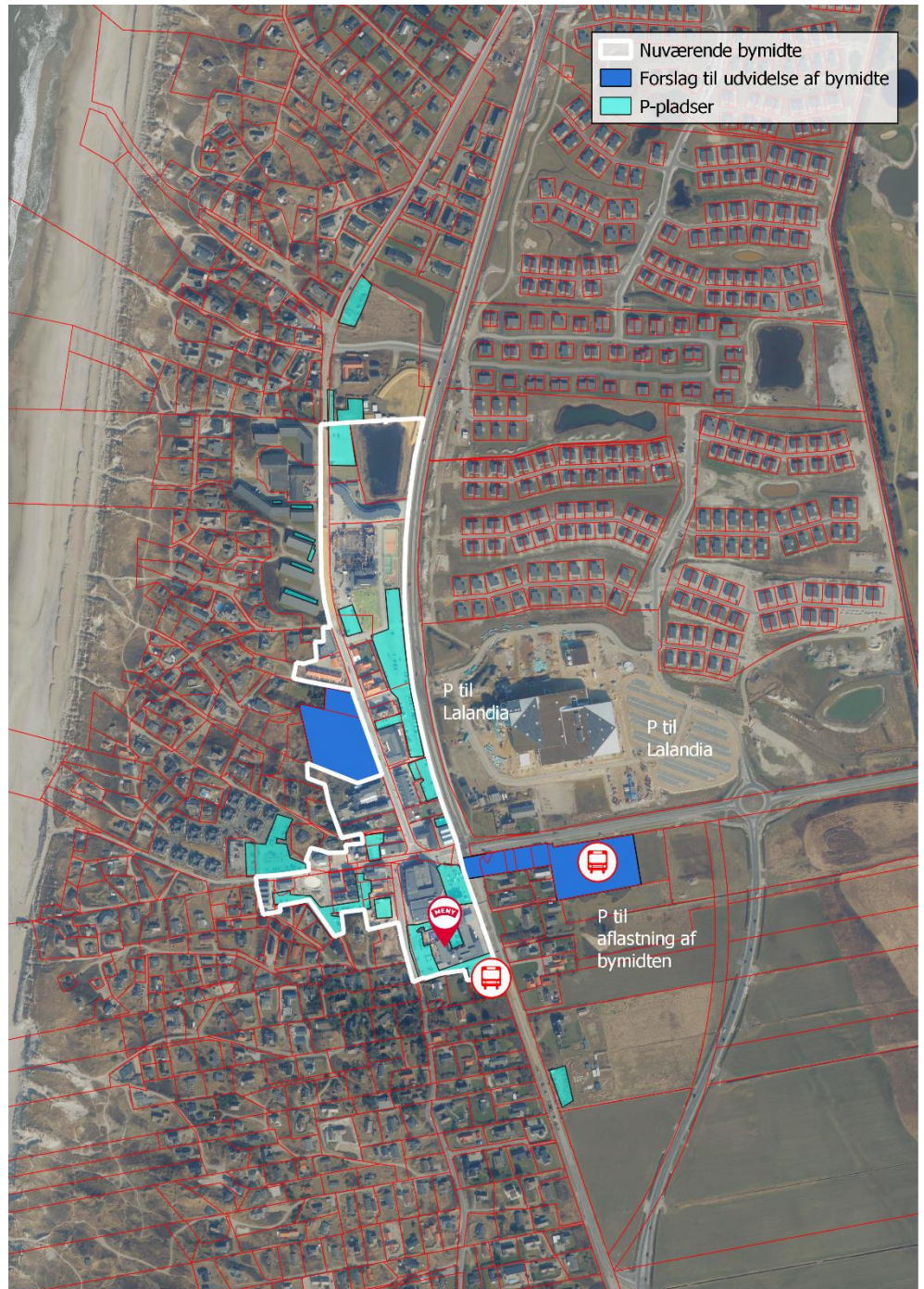
Figur 7-1 Nuværende bymidteafgrænsning, forslag til udvidelser af bymidten, busstoppesteder, eksisterende og planlagte p-pladser og eksisterende stor dagligvarebutik.