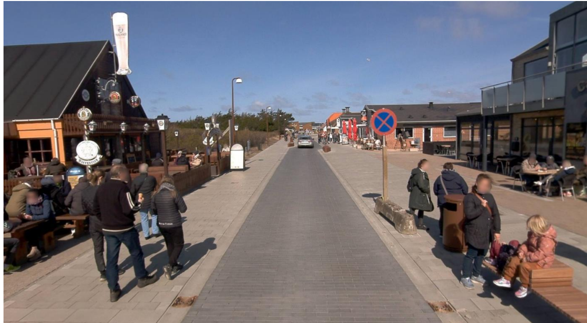
Figur 5-4 Område 3 er beliggende til venstre i billedet og udgør i dag et hul i den intensive del af handelsstrøg langs Lodbergsvej.

Området anvendes i dag til beboelse med et enkelt sommerhus på hver matrikel. Området ligger langs Lodbergsvej i direkte sammenhæng med den eksisterende bymidte. Området udgør et hul i handelsstrøget langs vestsiden af Lodbergsvejs og er beliggende i den intensive del af handelsstrøget langs Lodbergsvej. Der er på strækningen langs området stor tæthed i butikker, spisesteder og caféer, og mange færdes til fods på strækningen eller opholder sig på cafeer og spisesteder eller på bænke langs vejen.