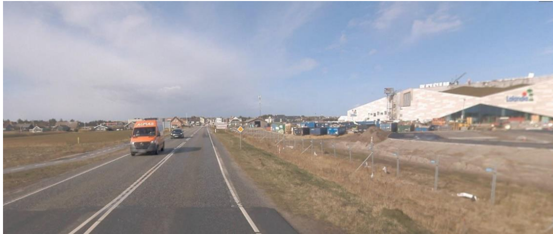
Figur 5-5 Område 4 ligger til venstre i billedet ind mod byen. Det ligger overfor Lalandia og har god biltilgængelighed. Der er 120 meter til bymidteafgrænsningen og 130 meter til nærmeste butik i bymidten.

Område 4 syd for Søndervig Landevej omfatter bl.a. del af matr.nr. 34bf Søgård Hgd., Nysogn. Her er der ønske om at etablere en ny dagligvarebutik på 1.200 m 2 .